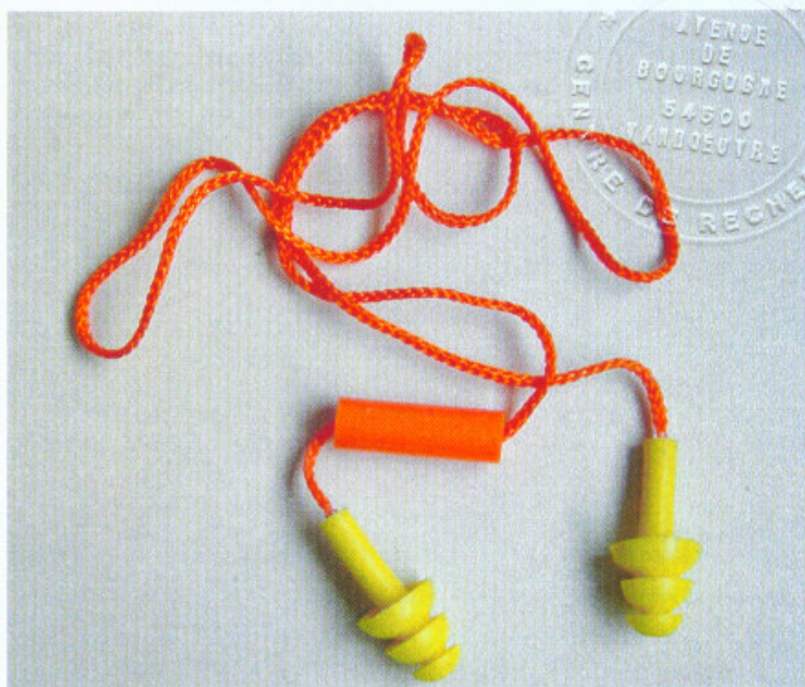
Photographie de l'équipement