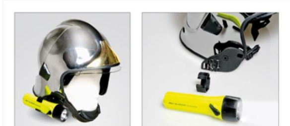
محل تعبیه چراغ قوه با قابلیت نصب آسان و سریع