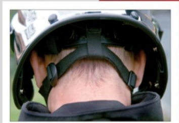
چانه بند چرمی قابل تنظیم و ضد اشتعال همراه با بند چرمی پشت گردن