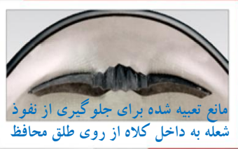
مانع تعبیه شده برای جلوگیری از نفوذ شعله به داخل کلاه از روی طلق محافظ صورت بیرونی

پوسته خارجی از جنس الیاف بلند نسوز کامپوزیت بادوام و طول عمر زیاد